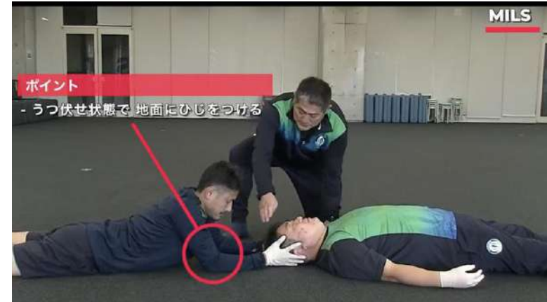
動画 MILS (Manual In Line Stabilization)